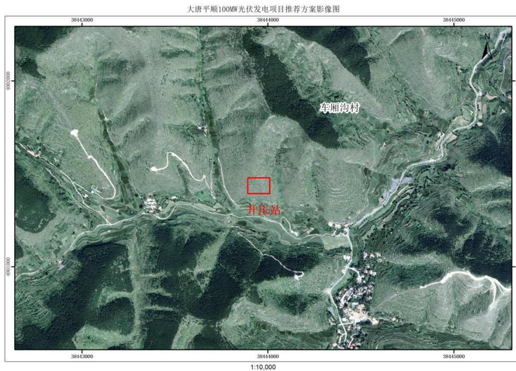
项目推荐方案影像图

公示时间：2025 年 7 月 9 日—2025 年 7 月 22 日， 共 10 个工作日。